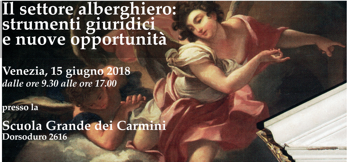
Antonio Balestra Il Sogno di Pietro , Scuola Grande dei Carmini

Scuola Grande dei Carmini Dorsoduro 2616